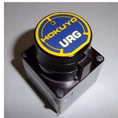
図 2 北陽電機株式会社製 URG-04LX

LRF は、追従対象者の発見、追従対象者までの距離、角度の取得を行うための情報を取得する本研究で最も重要なセンサである。