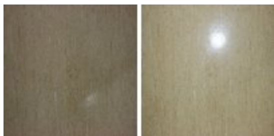
図1 画像例(左:光源なし 右:光源あり)