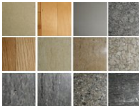
図2 用意した床画像