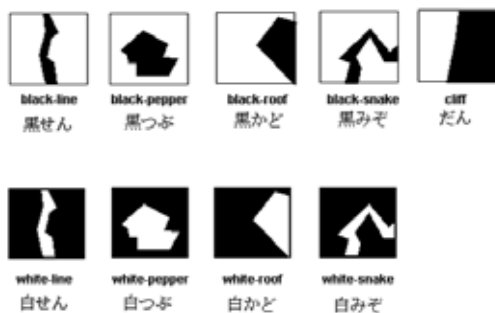
図 1 基本形状特徴要素

本研究ではネジ等の大きさと形状が同一の小片が堆積した状態の撮像画像からその堆積量の推定を試みる。推定に用いる特徴は、画像用非線形フィルタ群である形状通過型フィルタ[1]を用いて抽出した微小な形状特徴(図 1)とし、抽出した形状の種類と量により、堆積量の推定式を構築する。単一種類の要素が堆積した状態からはすでに十分な精度での推定が可能であった[2]が、本研究では画鋸を対象とし、輪ゴムを対象物を覆い隠す障害物とした混合画像からの推定を行い、そこから推定精度に及ぼす障害物の影響を評価し、混合物体における対象物の堆積量を高精度で推定する手法を確立する。