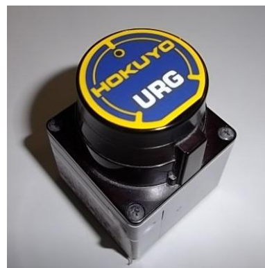
図 2 北陽電機株式会社製 URG-04LX

LRF は、追従対象者の発見、追従対象者までの距離、角度の取得を行うための情報を取得する本研究で最も重要なセンサである。