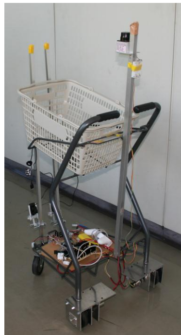
図 1 ショッピングカート全体像