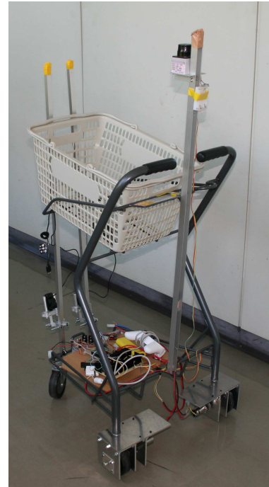
図1 自動追従ショッピングカート

図1が、実際にこれらを搭載した自動追従ショッピングカートである。また、これら装置は一般的なショッピングカートに搭載する事で動作させるため、カート形状の異なった店舗でも使用可能である。